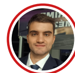
Place Sébastien Rhône (69) SABRE